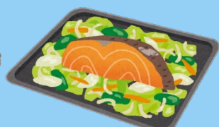
ちゃんちゃん焼き